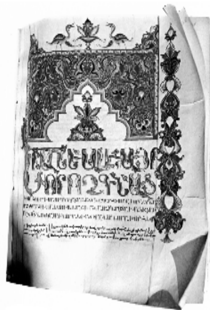
Mezi knihami, které se dochovaly až do dnešní doby je i Bible z roku 1658.

Nejstaršími chrámy jsou v Ečmiadzinu (484) a v Tekoru (486). K poutním místům patří mariánský klášter Angeg (Vaspukaran). V zahradě kláštera je horký pramen, ve kterém se poutníci koupali, aby získali