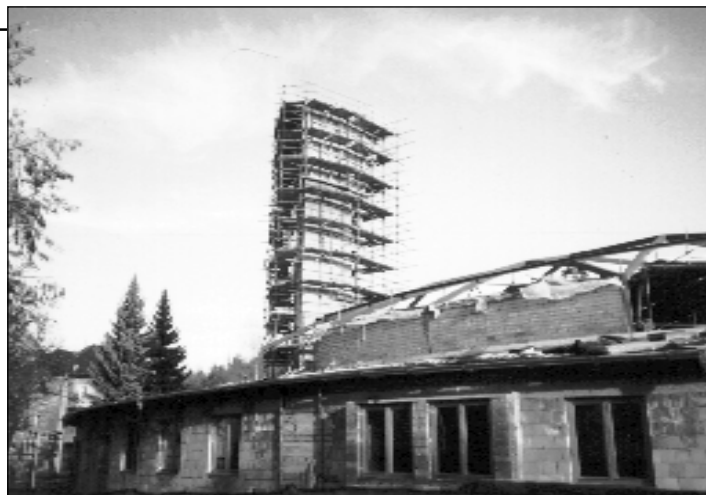
Věž nového farního kostela v Luhačovicích bude vysoká 27 metrů