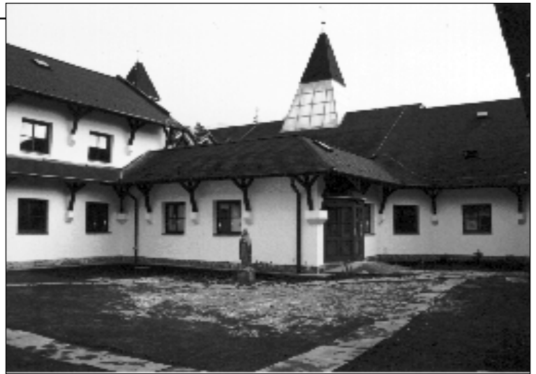
Pohled na kapli sv. Anežky České z vnitřního prostoru nového kláštera.