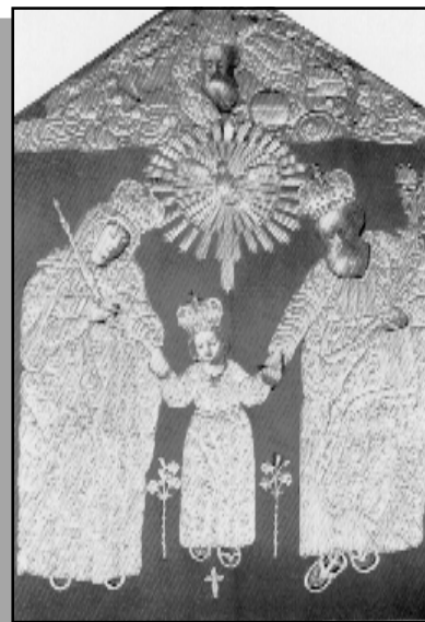
Obraz, který je zde uctíván, představuje Svatou Rodinu. Je namalován na plátně.

ku polských kněží. Všichni se zavázali, že v případě přežití navštíví kališskou svatyni. Němci uvažovali o různých způsobech, jak zahubit vězně, od otrávené potravy až po bombardování tábora. Nakonec rozhodli, že tábor bude zapálen, a ti, kteří se pokusí o útek, budou zastřeleni. Písemný rozkaz ke zničení tábora vydal Himmler 14. dubna 1945. Tábor měl být zapálen 29. dubna ve 21 hod. Avšak americká rozvědka přepadla nečekaně v 18.31 strážné věže tábora, došla z západní strany a zcela opanovala situaci. Hrozilo nadále nebezpečí ze strany německé zálohy v kasárnách ve Freimanu u Mnichova, ale silná americká dělostřelecká palba Němce zadržela. Od té doby se 29. duben stal poutním dnem