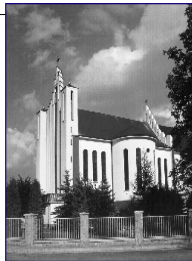
Debowiec – kostel Panny Marie lasalettské