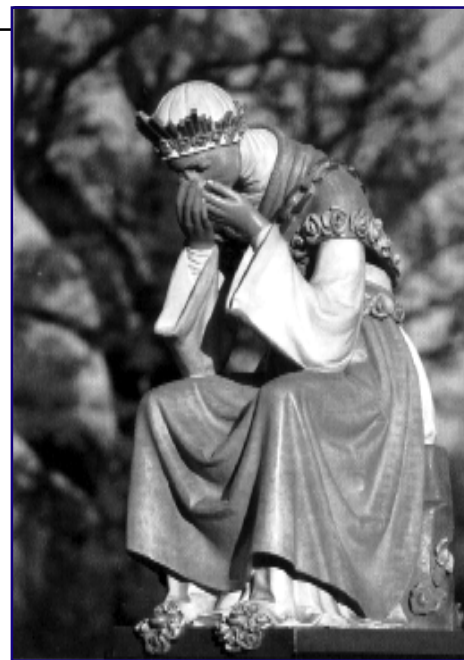
Plačící Matka Boží z La Saletty

Misionáři salettini ustavičně prohlubují studium poselství z La Saletty a přičiňují se, aby ukázali jeho trvalou hodnotu pro blížící se třetí tisíciletí. Oni jsou zvláštním způsobem zavázáni, aby předali všemu lidu výzvu k obnově křesťanského života, z něhož vznikl jejich řád v diecézi Grenoble. V tomto jubilejním roce je prosím, aby horlivě plnili své poslání v různých částech světa, kde konají svou službu. Rovněž povzbuzují sestry salettinky a jiné instituty, jejichž vznik a inspirace se pojí s událostmi v La Salettě. Modlím se, aby je Matka Kristova v tomto mimořádném roce provázela v jejich duchovní obnově, po které touží, a aby jim pomáhala, aby se věnovali evangelizačnímu poslání s misijním úsilím, jaké od nich církev očekává.