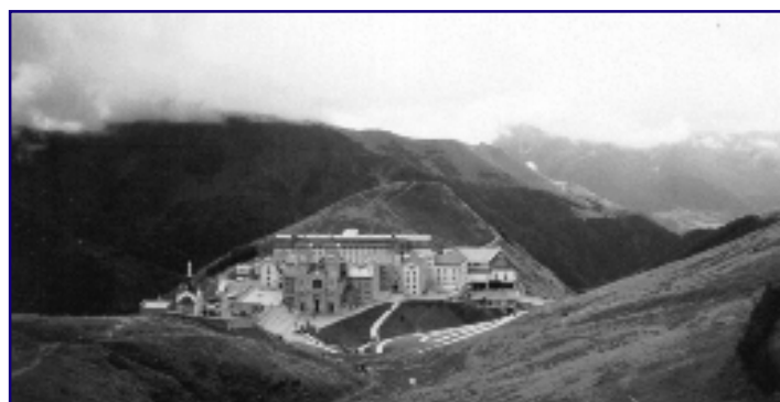
Pohled na La Salettu z okolních kopců.

Arnold Guillet (Z Timor Domini 2/96 přeložil —Iš—)