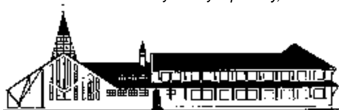
Model nového kláštera sv. Anežky České ve Šternberku.

Číslo konta: 975243-811/0100 KB Olomouc; konst. symbol: 379