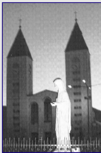
Medjugorje 25. 8. 1996