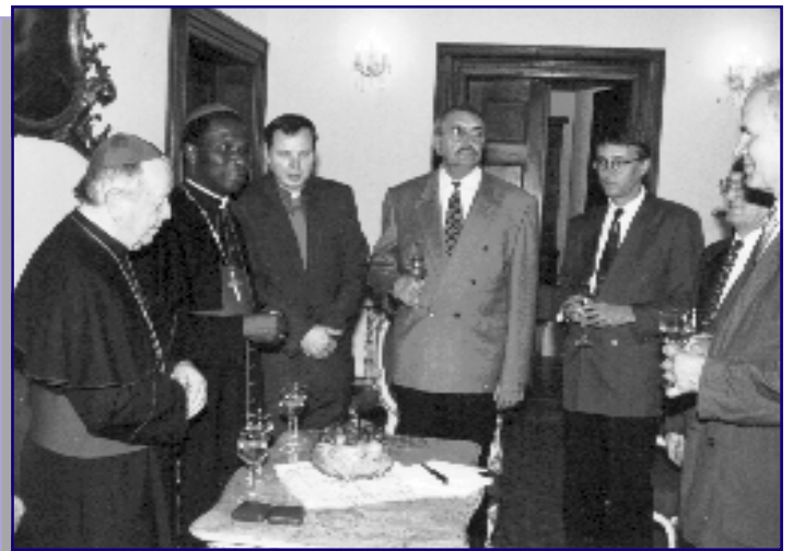
V biskupském domě v Hradci Králové pozdravily vzácného hosta autority města, okresu a zástupci školství.