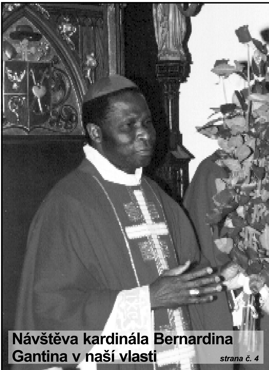
Návštěva kardinála Bernardina Gantina v naší vlasti