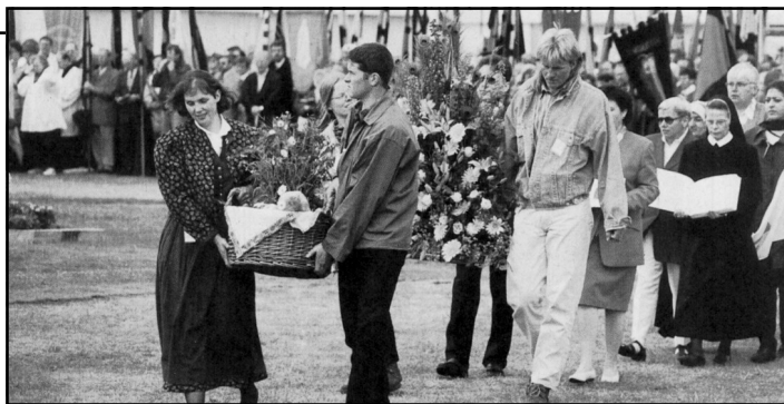
Přinášení obětních darů na paderbornském letišti

Pospěšme si, abychom sestavili velké martyrologium tohoto století, aby velká svědectví