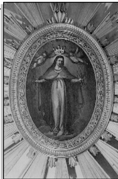
Laskavá Matka Boží, Patronka hlavního města

V r. 1970 Apoštolský stolec potvrdil slavnostně titul Matky Boží Laskavé – Patronky Varšavy. 7. října 1973 obnovil polský