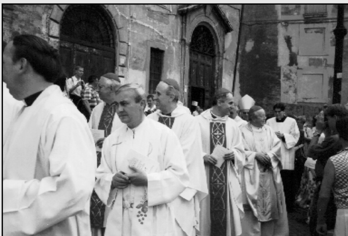
Naši biskupové ve slavnostním průvodu spolu s poutníky

(Těmito slovy přivítal otec biskup Josef Hrdlička římské poutníky na začátku mše svaté.)