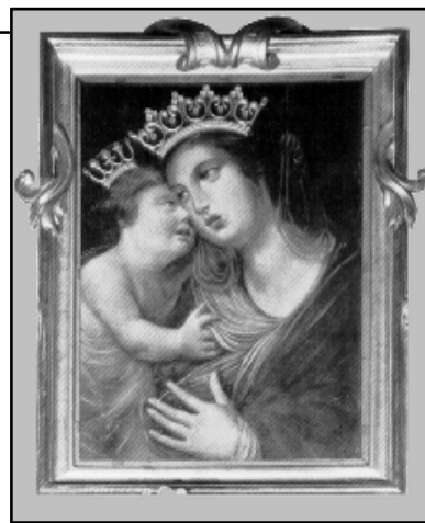
Obraz je dílem neznámého italského malíře z období pozdní renesance.

Kult Matky Boží Myslenické se dostal ke konci XVIII. století poněkud do stínu poutního místa Kalvárie Zebrzydowské, která je odtud vzdálena pouhých 30 km. Mnoho poutníků obrátilo své kroky ke kalvarským cestičkám a odpustkům, ale všichni ti, kteří přicházeli kolem Myslenic, navštívili také zdejší mariánskou svatyni.