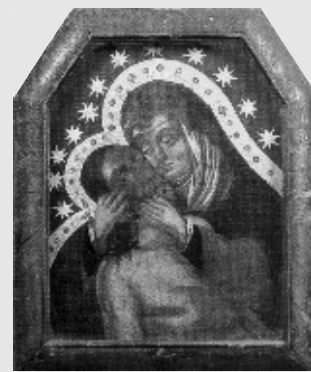
Milostný obraz Panny Marie Bolestné ve Stříbře

Velké slavnosti umístění obrazu na hlavním oltáři se v slavnostním průvodu účastnili čtyři opati a třicet šest kněží. V dalším roce pořídil radní Achwandtner k obrazu pozlacenou korunu ze stříbra a sošky anděličků. V těch letech navštívilo obraz mnoho tisíc lidí. S prosbami a modlitbami k obrazu Matky Boží přicházeli do Stříbra poutníci i ze vzdáleného