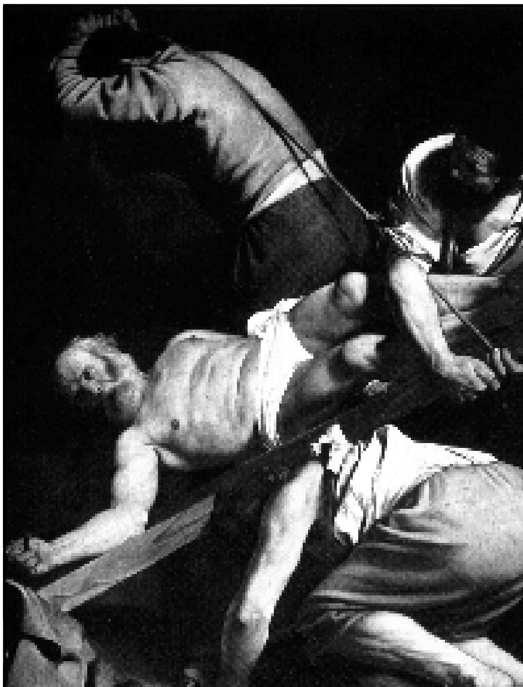
Caravaggio, Ukřižování svatého Petra, Řím – ilustrace k článku na straně č. 4