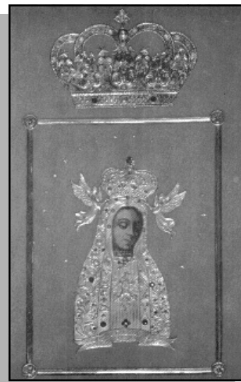
Licheň – Bolestná Královna Polska, obraz z XVIII. stol., o rozměrech 23x16 cm.