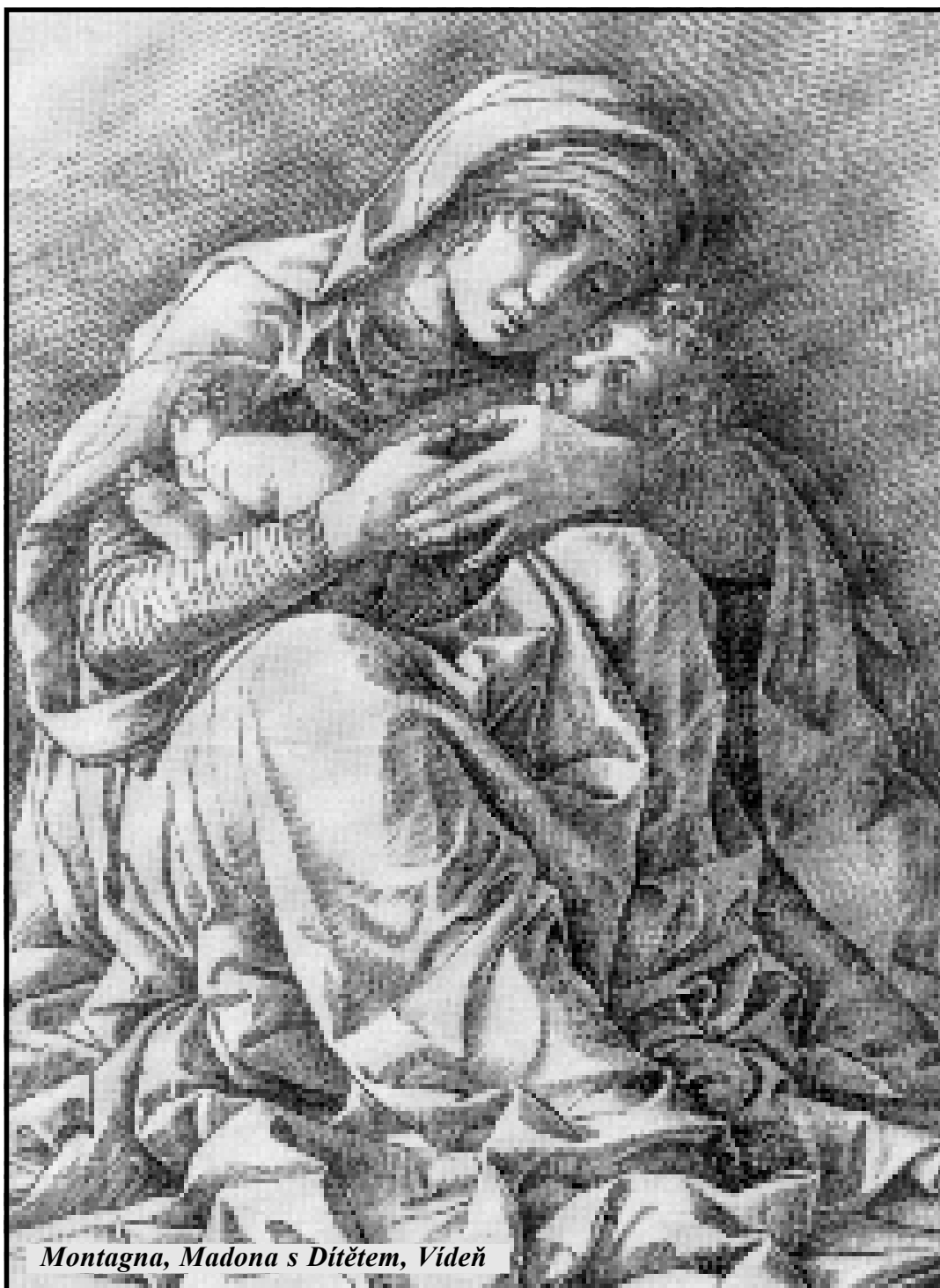
Montagna, Madonna s Dítětem, Vídeň