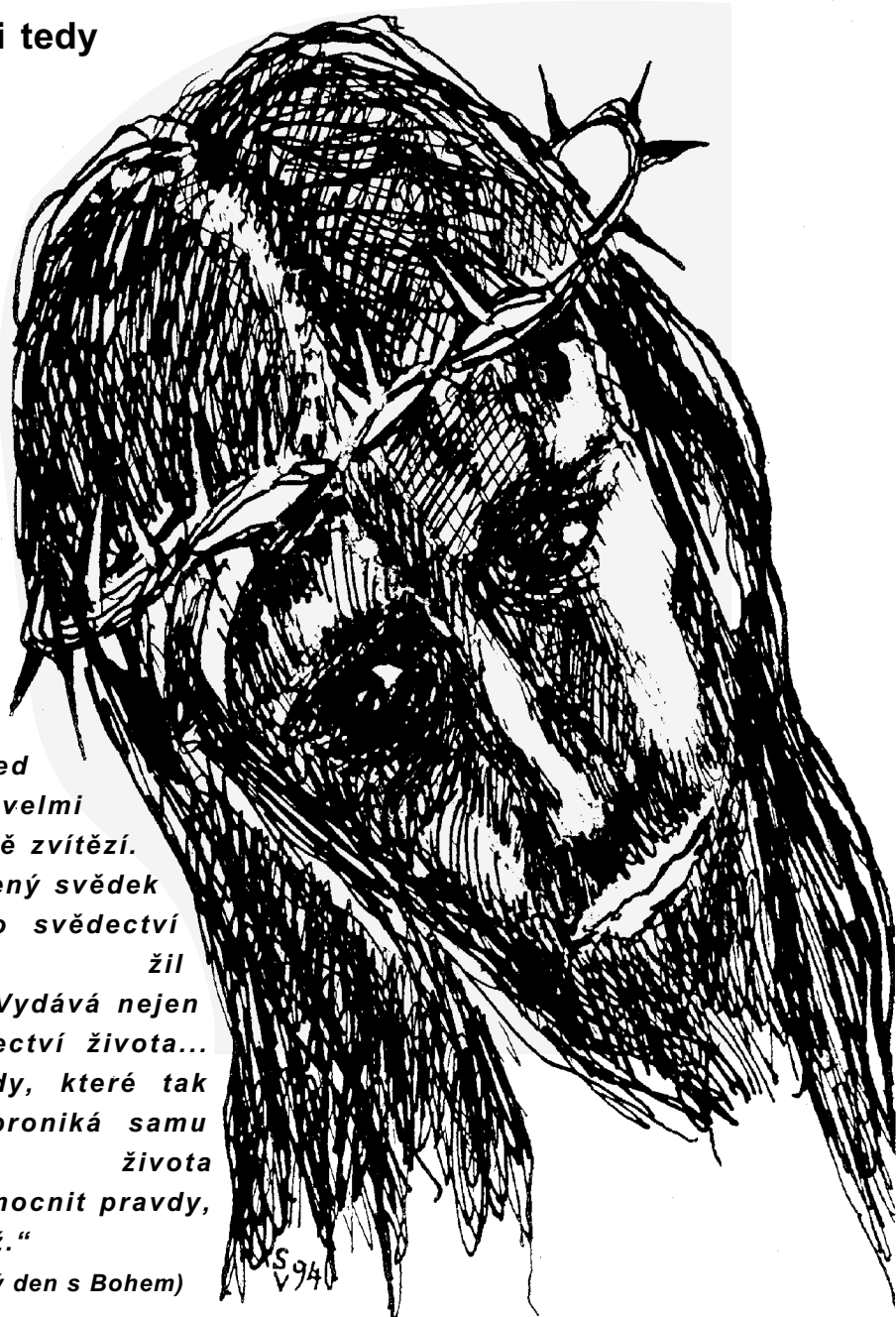
Ilustrace V. Stratilová