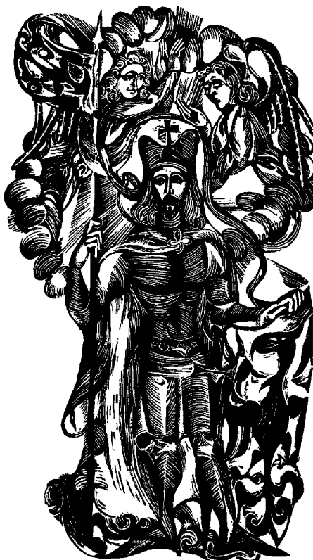
Sv. Václav - dřevoryt Antonína Strnadela z roku 1947 (reprodukováno na obálce publikace Kons-tantina Miklíka „Byl svatý Václav ženat?“)