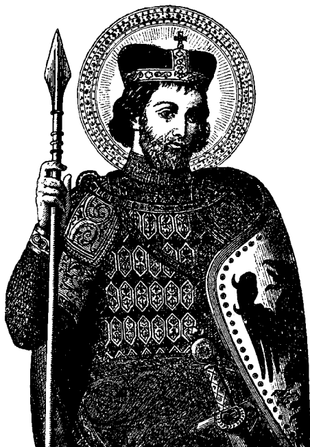
Staroboleslavský obrázek sv. Václava (mědirytina)