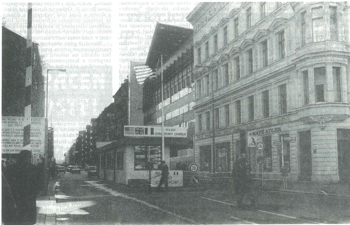
Hraniční přechod mezi bývalým Východním a Západním Berlínem. Tenkrát jsme hleděli na Západ s obdivem. Dnes vidíme, že i odtud k nám přichází leccos špatného.