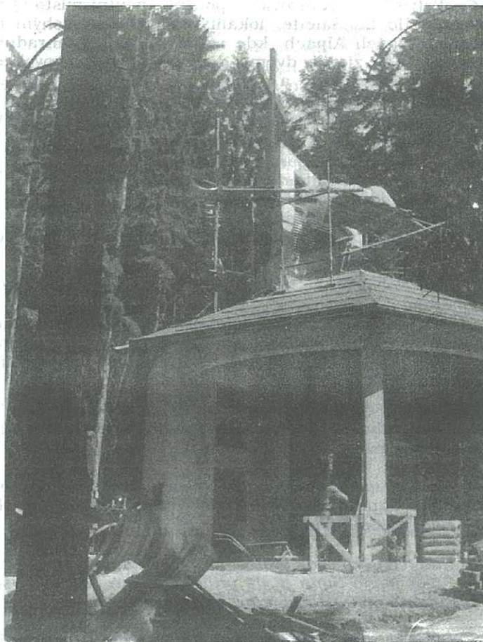
rozestavěná kaple na Živčákové, srpen 1993

Zpráva o události se rychle rozšířila a přinesla La- (pokračování na str. 13)