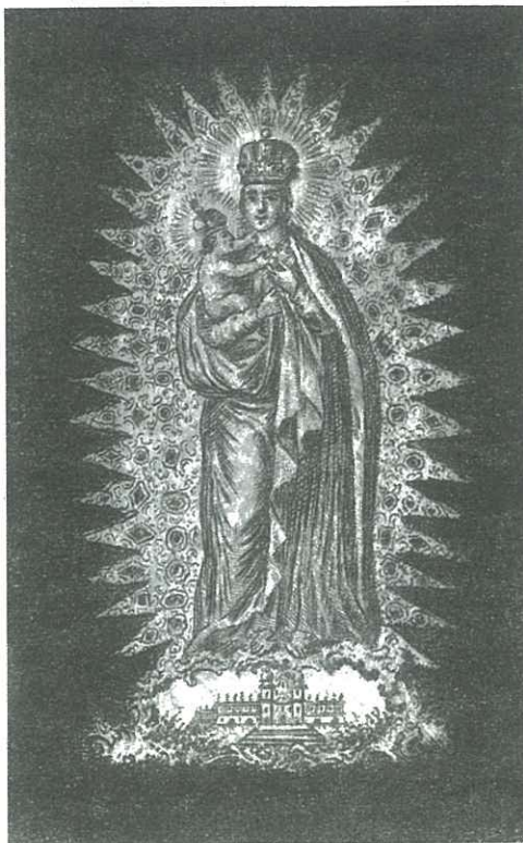
Panna Maria na Svatém Kopečku (rytina, 19. století)

“Nebojím, neboť vidím zde celou řadu vpravdě mariánských kněží, zejména u vás na Moravě. To na Západě není, tam takto orientovaní duchovní jsou spíše výjimkou. Dalším