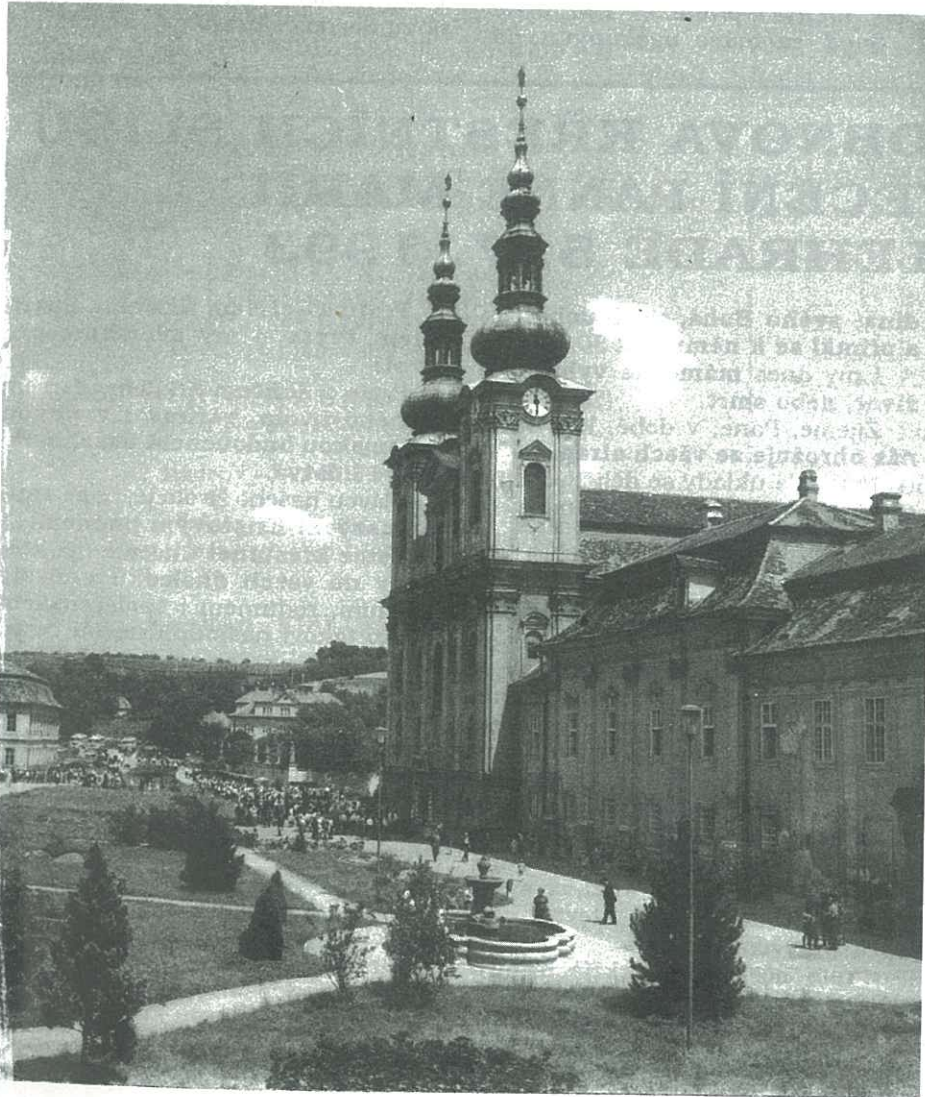
Velehradská bazilika

Velehrad náš, ten rozkvétá vždy znova a žádná moc už nám jej nerozboří, pokud náš národ v hloubi srdce chová důvěru k Matce, která divy tvoří. Mária za nás prosit nepřestane: Dědictví otců zachovej nám, Pane!